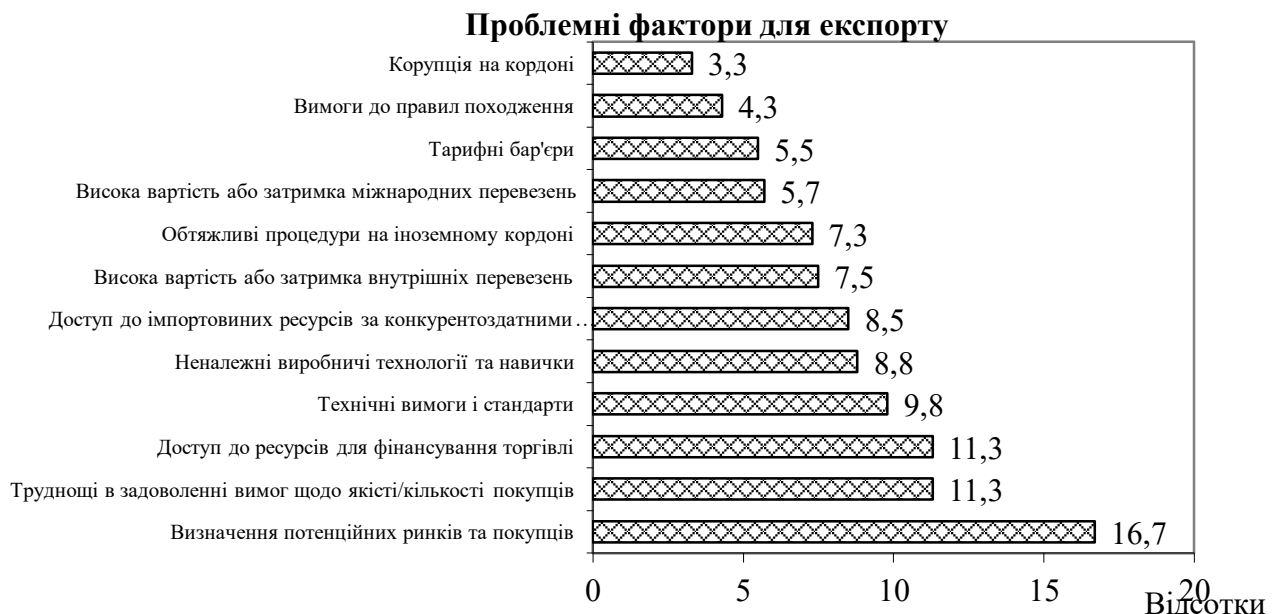
Рис. 1. Структура проблемних факторів в Україні для здійснення експортних операцій [10]

Це, на нашу думку, суттєво ускладнить процес системного та предметного уявлення, стосовно формування та реалізації політики розвитку підприємництва та вимагає уточнення даної дефініції.