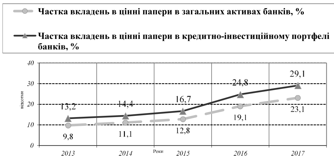
Рис. 2. Частки вкладень в цінні папери в загальних активах і кредитно-інвестиційному портфелі вітчизняних банків в 2013-2017 рр., %*