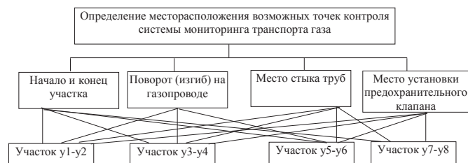
Рис. 2. Схема определения возможных точек контроля

Указанные условия можно выразить следующей схемой для определения возможных точек контроля системы мониторинга (рис. 2), в которой указаны основные условия, которые следует учитывать при выделении возможных мест расположения точек контроля.