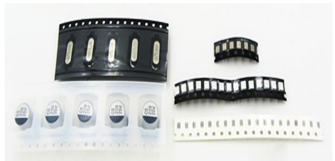
Рис. 1. Приклади SMD компонентів запаковані у стрічці [5]

В залежності від розміру та пропорцій корпусу компоненту різняться також і розміри пакувальної стрічки, але розташування, орієнтація та розміри отворів на краях стрічки є статичними та незмінними (рис. 1).