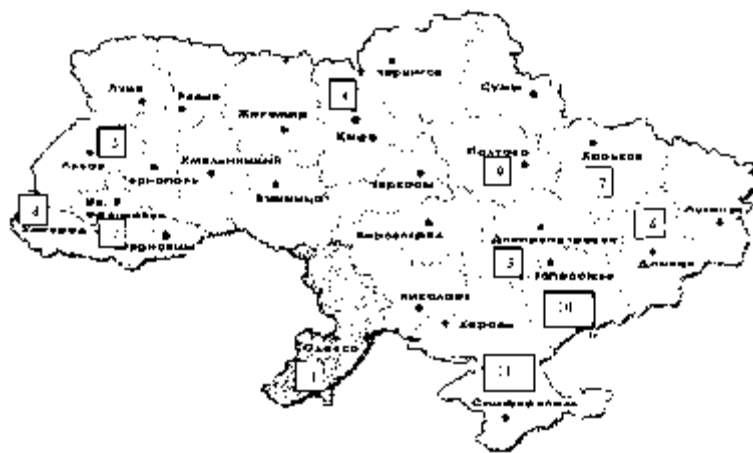
Рис. 2. Оцінка регіонів України

При цьому Східна Україна – найбільш індустріальний і густонаселений регіон країни, що включає Харківську, Луганську, Донецьку і Запорізьку області, виявилася найбільш економічно розвиненою, а Північна Україна, навпаки, включає найменш конкурентоспроможні області.