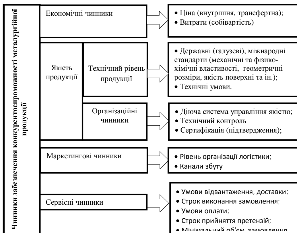
Рис. 2 - Чинники конкурентоспроможності металургійної продукції інтегрованого підприємства.

Враховуючи вищесказане, виділено загальні чинники конкурентоспроможності металургійної продукції інтегрованого підприємства (рис. 2.), що сприяє подальшому розвитку системи управління конкурентоспроможності в цілому та розробки системи показників оцінки конкурентоспроможності продукції зокрема [5].