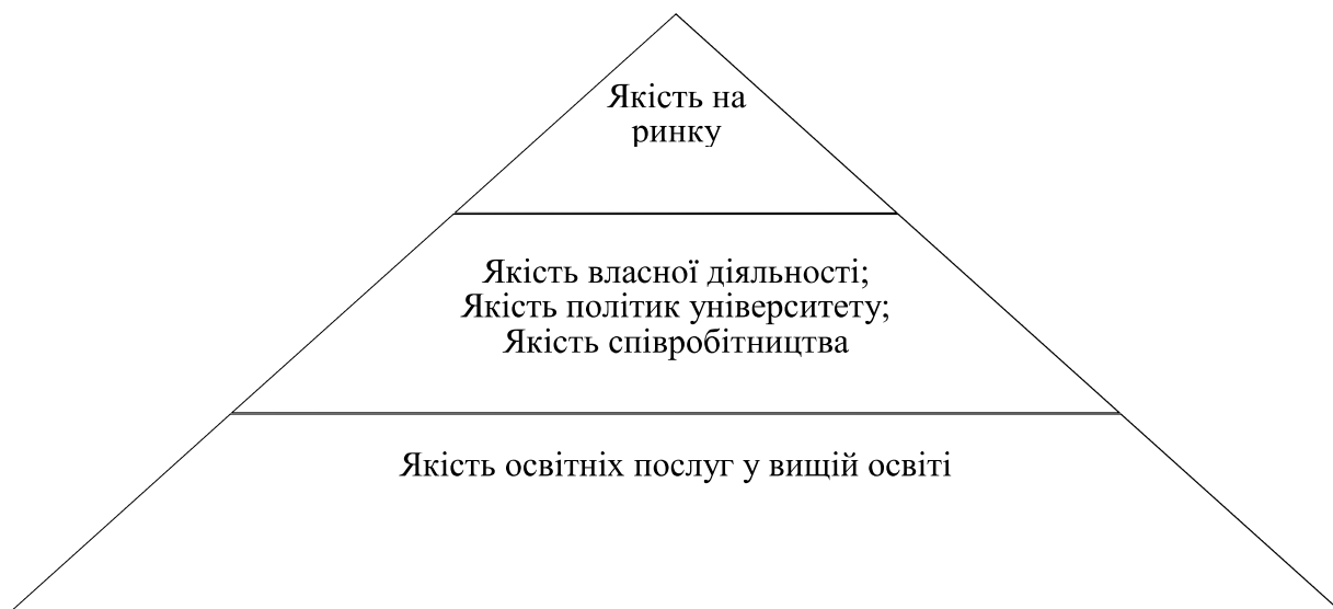
Рисунок 3 – Ієрархія пріоритетів моделі повного управління якістю у вищій освіті [31].

Запровадження вимог щодо забезпечення якості в системі вищої освіти США є результатом еволюції суспільної думки, яка наразі прагне врівноважити якість та вартість освітніх послуг, які в США є одними з найвищих у світі. Одним з основних мотивів еволюції у цьому напрямку є значна частка ВВП, та відповідно коштів платників податків у бюджетах різних рівнів, що спрямовуються на освітні цілі. Логіка еволюції економіки засвідчує перехід США до парадигми економіки знань, в якій освітня діяльність розглядається серед ключових компонентів забезпечення конкурентоспроможності економічних суб'єктів всіх рівнів.