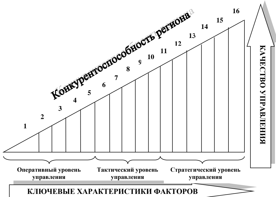
Рисунок 2 – Ключевые характеристики развития региона экономических реформ

Государственная региональная политика должна быть тем фактором, которая позволит регионам развиваться и при недостаточно благоприятных условиях. Концептуальная модель социально-экономического развития регионов при реализации экономических реформ должна предусматривать использование обеспечивающих факторов для поддержки развития факторов продуктивной и устойчивой группы факторов, а не наоборот. Соответственно, реформы должны иметь четкую направленность на развитие приоритетных групп факторов, которые формируют конкурентное преимущество, для конкретно взятого региона или отрасли в экономике региона.