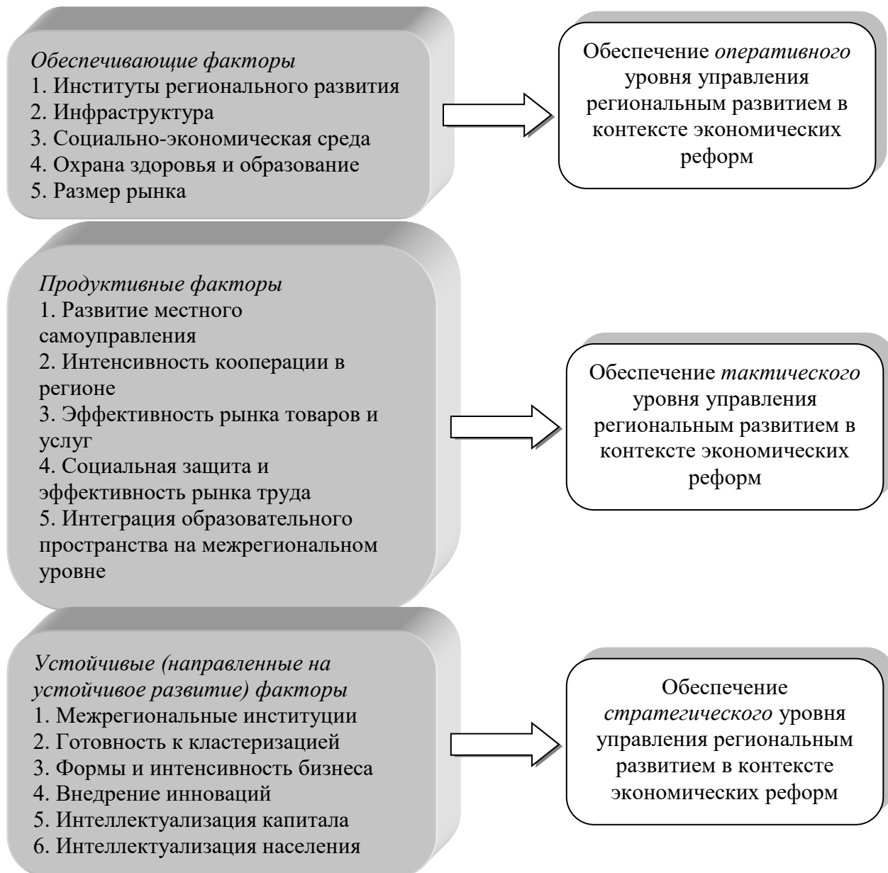
Рисунок 1 – Факторы регионального экономического развития, которые необходимо учитывать для реализации экономических реформ

развития регионов Украины уже закреплены нормативно в Законе Украины «Про основы государственной региональной политики» (№ 156-VIII от 05.02.2015 г.), как общий замысел и конструктивный принцип деятельности государства, определяющий главную цель государственной политики относительно регионального развития, основные ее направления и задачи, которые следует решить для ее достижения.