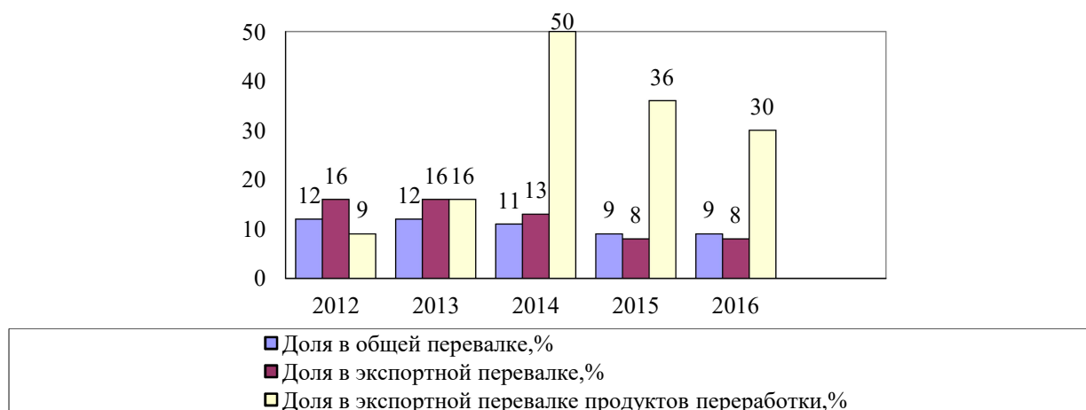
Рис. 2. Суммарная доля двух портов Азовского моря в общей и экспортной перевалке грузов, построена на основании [5].

Так, согласно данным Администрации морских портов Украины (АМПУ), за последние 5 лет суммарная доля двух портов Азовского моря в общей перевалке грузов из Украины сократилась с 12 до 9%. В частности, общая перевалка грузов в Мариупольском порту за 5 лет сократилась на 49% и в 2016 г. составила 7,6 млн. тонн против 14,9 млн. тонн в 2012 г. В то же время, в Бердянском порту наблюдается прирост объемов перевалки на 50% (с 2,5 млн. до 3,8 млн. тонн за тот же период) [4].