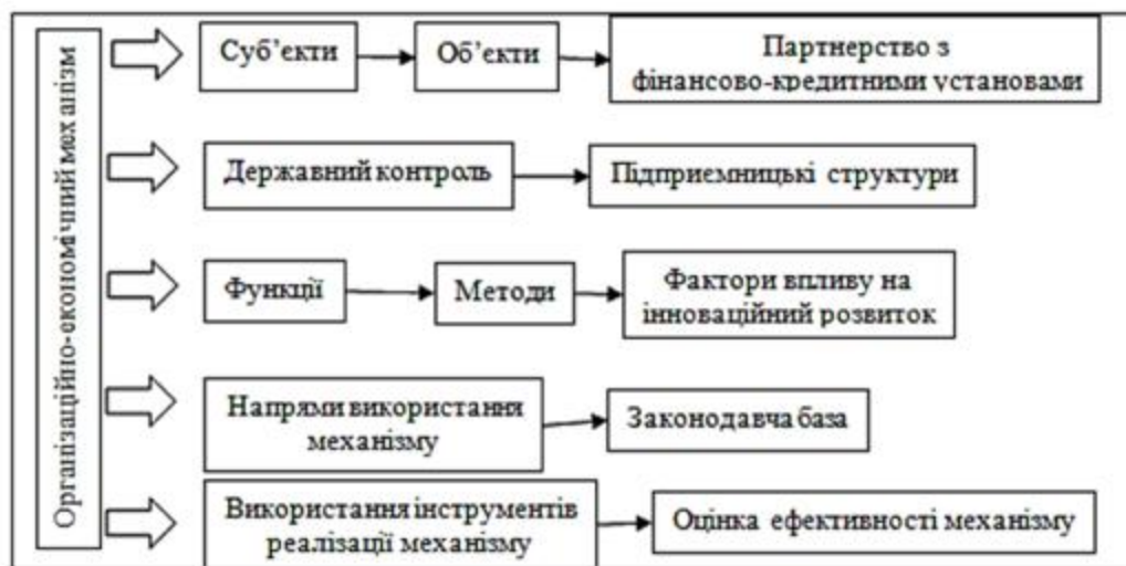
Рис. 2. Складові організаційно-економічного механізму активізації інноваційного розвитку

Тивончук С. О., Тивончук Я. О. розробили підходи до формування механізму активізації інноваційного розвитку підприємства, який дозволить подолати технологічне відставання, впровадити інновації у виробництво, організувати інноваційну діяльність (рис. 2).