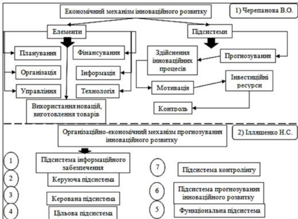
Рис. 1. Складові економічного механізму інноваційного розвитку

Серед елементів механізму було визначено: процес управління, забезпечення інформацією, фінансами, матеріалами, технологією, планування та організація діяльності, доцільність залучення інновацій. Серед підсистем механізму вагому роль мають: контроль за розвитком підприємства; стимулювання персоналу; наявність фінансів; інформаційне середовище; прогнозування інноваційного розвитку. Недоліком даного підходу є неврахування в економічному механізмі дії ризиків, невизначеності подальшого розвитку, змінності цілей діяльності підприємства.