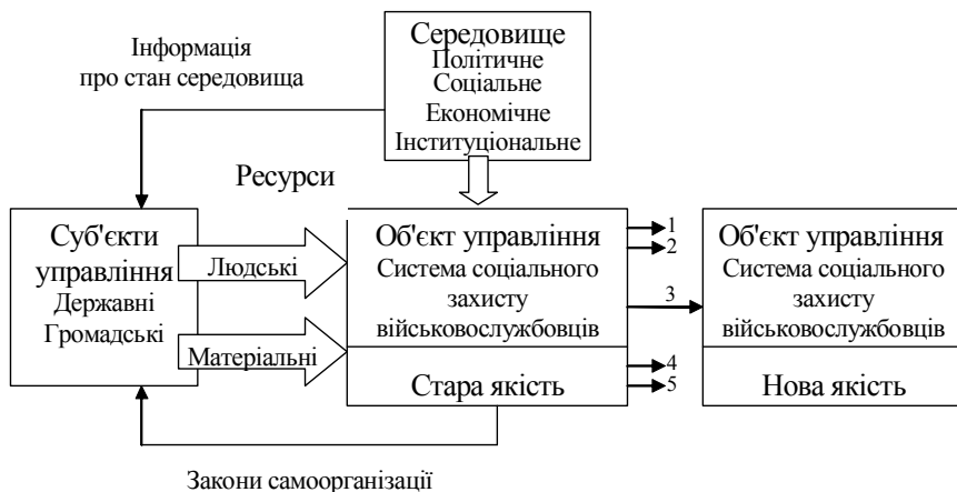
Рис. 1. Структурна схема синергетичного управління системою соціального захисту військовослужбовців

представити загальну систему соціального захисту військовослужбовців як алгоритм спільної діяльності окремих підсистем системи соціального захисту, що забезпечують досягнення результатів відповідно до їх місця та завдань у загальній схемі структурно-функціональної побудови.