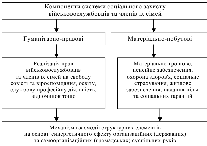
Рис. 2. Компоненти системи соціального захисту військовослужбовців та членів їх сімей