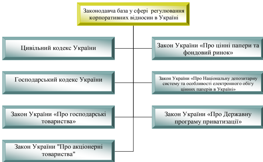
Рис. 1. Законодавство у сфері корпоративних відносин в Україні

Аналізуючи стан нормативного регулювання, потрібно також враховувати, що правовий статус багатьох акціонерних товариств визначається також банківським, страховим, інвестиційним, валютним законодавством, законодавством, що регулює професійну діяльність на ринку цінних паперів, тощо [3].