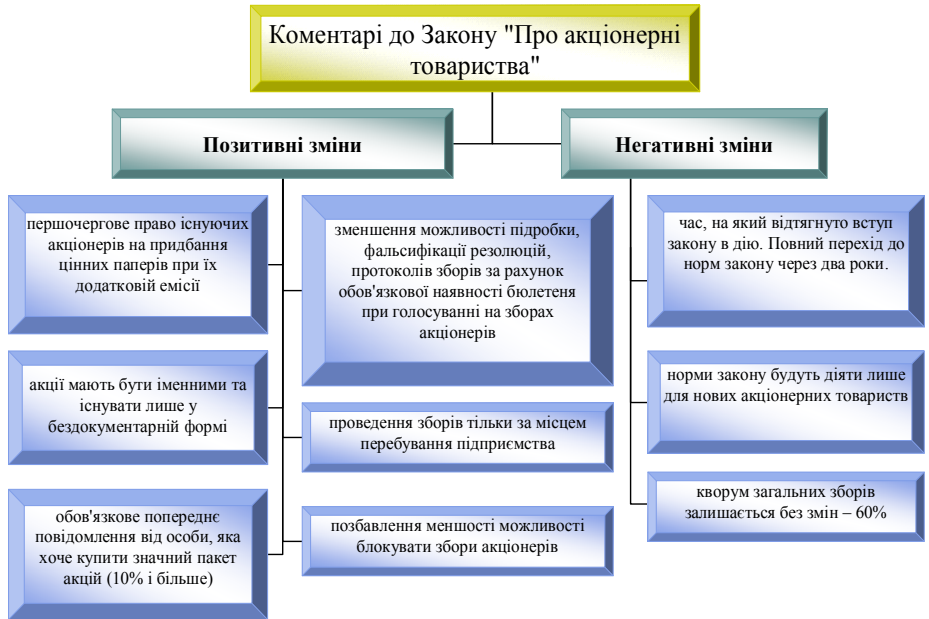
Рис. 2. Позитивні і негативні моменти Закону України “Про акціонерні товариства”

Практика доводить, що для різних сфер, галузей, ланок економіки підходять свої специфічні форми власності, краще ніж інші пристосовані до певних умов виробництва, обміну та загальноекономічного стану в державі. Досить успішно можуть працювати з абсолютною або значною державною часткою такі види підприємств: вугледобувні, металургійні, оборонні, залізниця, електростанції, підприємства транспорту та зв'язку. Характерною особливістю таких підприємств є погрєба у складному і громіздкому обладнанні, значні капіталовкладення в основні фонди тощо. Базою застосування державної форми власності є ті сфери економіки, в яких об'єктивно велика потреба в прямому централізованому управлінні, здійсненні державних інвестицій, а орієнтація на прибутковість не є критерієм, достатнім для функціонування в суспільних інтересах.