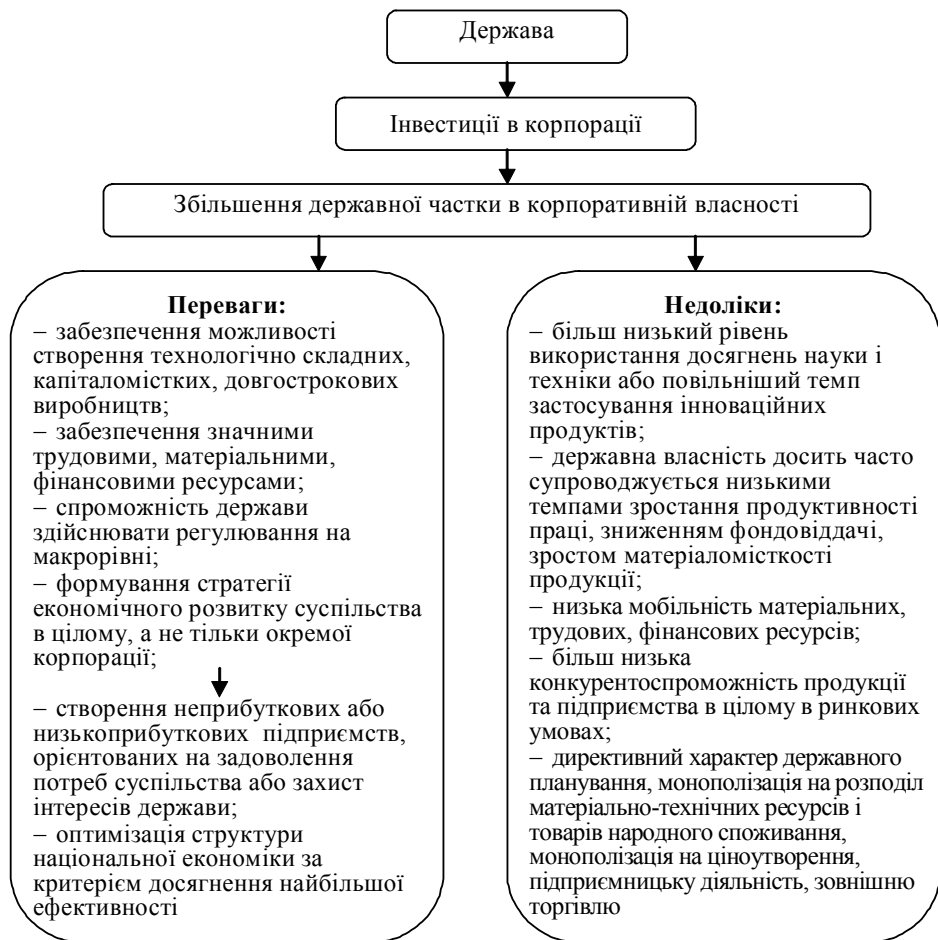
Рис. 3. Переваги та недоліки збільшення державної форми власності

Таким чином, для кожної форми власності, а також варіантів їх поєднання є певне місце, де найбільш продуктивно виявляється конкретна, а не будь-яка форма власності, залежно від історичних, політичних, економічних факторів, обсягу, сфери, галузі діяльності.