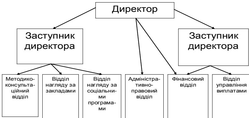
Рис. 1. Структура департаменту

та координація роботи закладів соціальної опіки. Але набутий досвід у цій сфері, нове розуміння проблем, змусили піти на вдосконалення положень цього Закону. Після прийняття в 2006 р. нового Закону “Про соціальні послуги” [1] Департамент було реорганізовано. На сьогодні він здійснює єдину для Литовської Республіки політику у сфері соціального захисту вразливих категорій населення, в тому числі шляхом організації системи соціальних послуг та контролю за її діяльністю (рис. 1).