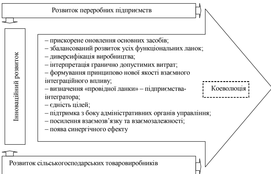
Рис. 1. Коеволюція процесу інтеграції підприємств переробної промисловості та сільськогосподарських товаровиробників

Використовуючи ідеологію коеволуційного процесу інтеграції, коеволуцію підприємств переробної промисловості й сільськогосподарських товаровиробників можна визначити як сукупність органічно цілісних змін, що приводять до значного посилення їхнього взаємозв'язку (поява єдності цілей, формування на цій основі принципово нової якості взаємного впливу на науково-технічний прогрес), при переході галузей АПК до інноваційного розвитку (рис. 1).