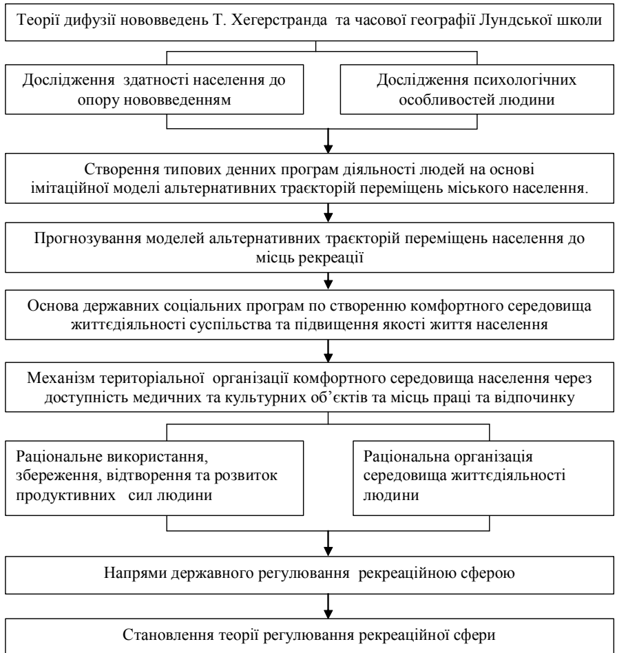
Рис. 1. Основні положення теорії просторово-часової динаміки Т. Хегерстранда у становленні теорії регулювання рекреаційної сфери

У буденності скриті можливості зміни способу існування людини з головним протиріччям сучасності між технологічним прогресом, що видозмінює всі форми соціалізації, та новим типом існування, який з'являється і виникає поза загальним рухом історії. В умовах сучасності повсякденне життя стає більш значимим, ніж сфера виробництва. Тому позитивні зміни суспільства повинні бути пов'язані з проникненням гуманізму, людяності в будь-яку повсякденність, зокрема в містобудівну сферу міста та сферу позаробочої діяльності [9].