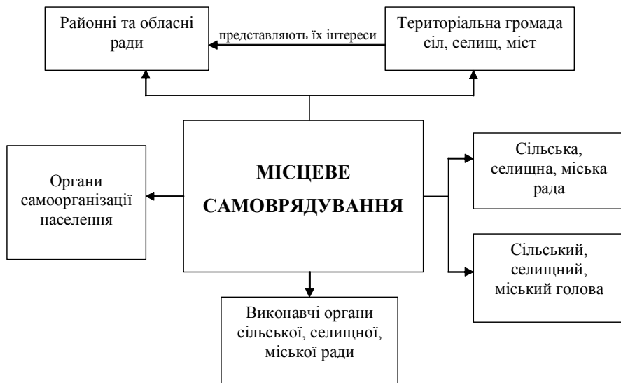
Рис. 1. Місце виконавчих органів місцевих рад у системі місцевого самоврядування

Під виконавчим органом місцевої ради необхідно розуміти відносно відокремлену частину ради, яку складає колектив громадян, що здійснює виконавчо-розпорядчі функції на підставі владних повноважень і діє за допомогою визначених форм організації та методів діяльності.