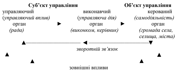
Рис. 1. Система управління

До основних складових системи управління відносять суб'єкт управління, виконавчий орган (які можуть бути об'єднані в єдине ціле), об'єкт управління, механізми управління, інформаційні та управлінські зв'язки. Схематично систему управління дослідники зображують таким чином [6, с. 14]: