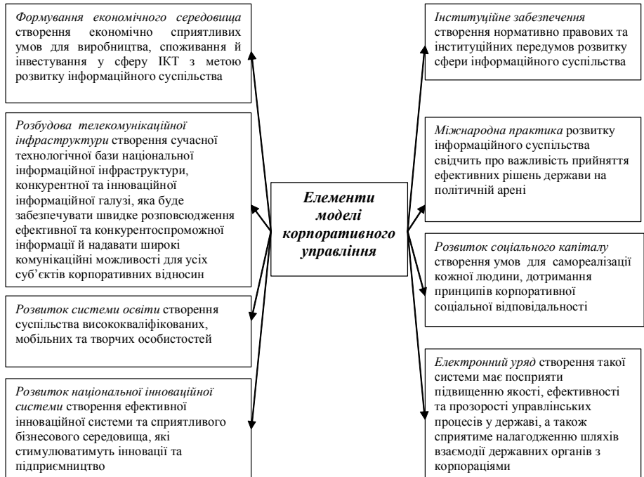
Рис. 2. Структурні елементи моделі корпоративного управління України

На першому етапі визначається державна політика щодо розвитку корпоративного управління (КУ) в інформаційному суспільстві. Далі проводиться аналіз чинників розвитку корпоративного управління в Україні, які умовно можна поділити на внутрішні та зовнішні. До внутрішніх чинників розвитку КУ можна віднести розвиток законодавчої бази, інформаційно-комунікаційні технології (ІКТ), захист прав інвесторів, дотримання міжнародних стандартів у діяльності корпорацій, корпоративна прозорість корпоративних відносин. Зовнішні чинники (загальні) включають елементи розвитку зовнішнього середовища, в якому функціонує корпорація. До них можна віднести розвиток фінансового ринку України та можливість доступу до інвестиційного капіталу.