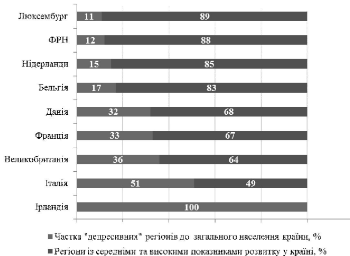
Рис. 1. Питома вага “депресивних” регіонів у країнах – членах ЄС

За даними досліджень Інституту реформ, існують декілька чинників, що зумовлюють депресивний стан території (рис. 2) [3].