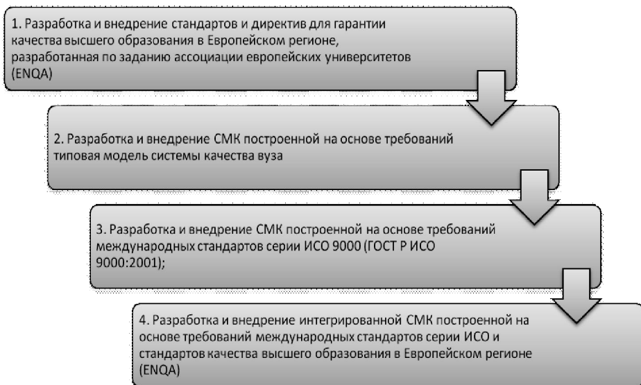
Рис. 2. Варианты СМК высшего учебного заведения

В связи с тем, что модели СМК построенные на требованиях Международной премии Европейского фонда менеджмента качества (EFQM) и Премии правительства РФ по качеству ориентированы преимущественно на производственные предприятия, выбор модели для построения СМК вуза сводится к выбору одного из следующих вариантов (рис. 2):