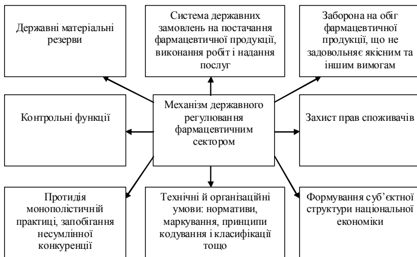
Рис. 1. Механізм державного регулювання фармацевтичного сектора

Одним із важливих системних рішень державних органів управління фармацевтичним сектором країни є формування відповідної системи лікарського забезпечення, яку слід розглядати як важливий стратегічний напрямок розвитку цієї галузі. Враховуючи, що складовими даної галузі є окремі аптечні мережі та виробничі підприємства, слід прийняти визначення, надане автором роботи [4, с. 8–20], відповідно до якого система лікарського забезпечення – це контрольована державою сукупність взаємопов'язаних підприємств, що здійснюють виробництво і доведення лікарських засобів до споживачів (рис. 2).