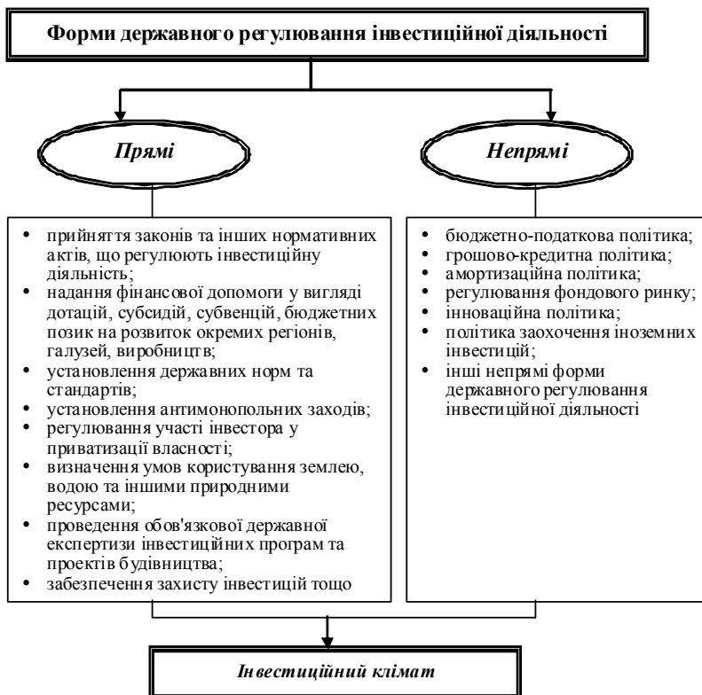
Рис. 1. Важелі державного впливу на інвестиційний клімат