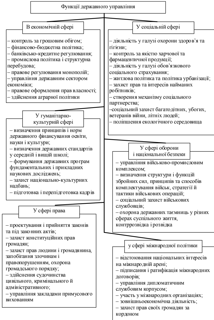
Рис. 1. Функції державного управління