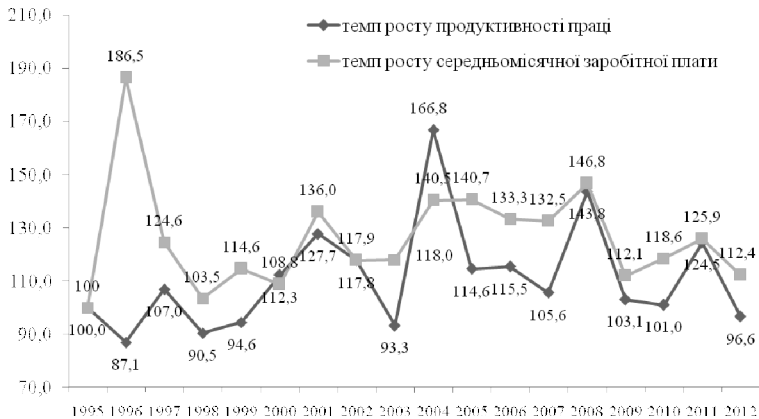
Рис. 1. Динаміка темпів зростання продуктивності праці та заробітної плати в галузі сільського господарства України

Більш глибокий аналіз продуктивності праці за видами економічної діяльності, результати якого представлені в праці Л. Ткаченко, дає підстави стверджувати, що не низька продуктивність у ряді галузей національної економіки обумовлює низьку оплату праці найманих працівників, а навпаки, низька заробітна плата (як база нарахувань соціальних внесків роботодавців та формування оплати праці найманих працівників) обумовлює низьку продуктивність, оскільки обмежує обсяги створюваної доданої вартості [20]. Так, у сільському, лісовому, рибному господарстві, мисливстві лише 20,4 % валової доданої вартості становить оплата праці. І саме через низьку зарплату (на 30 % нижче середньої по економіці), цей вид діяльності має порівняно низький рівень продуктивності праці – на 45 % нижче від середнього по економіці.