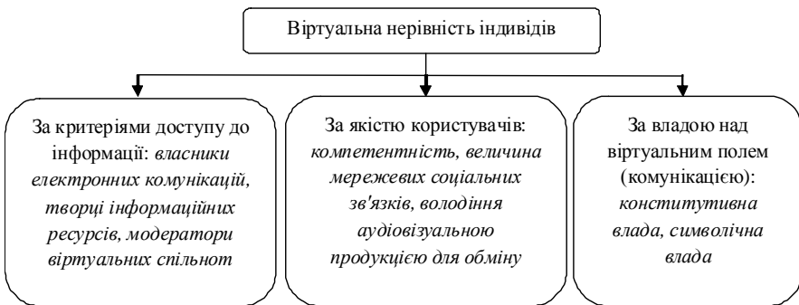
Рис. 2. Віртуальні нерівності у віртуальному просторі

Проте віртуальна нерівність індивідів, що беруть участь у віртуальній спільноті, може бути розподілена за критеріями доступу до інформації відповідно до статусу їх владних повноважень в ієрархіях електронної комунікації [7] (рис. 2). Наприклад, можливо виділити три статусні групи: власники електронних комунікацій (мають право власності), творці інформаційних ресурсів (мають право на участь у створенні інформаційного ресурсу), модератори віртуальних спільнот (мають право управління спільнотою) і користувачі (мають право на участь у діяльності віртуальної спільноти).