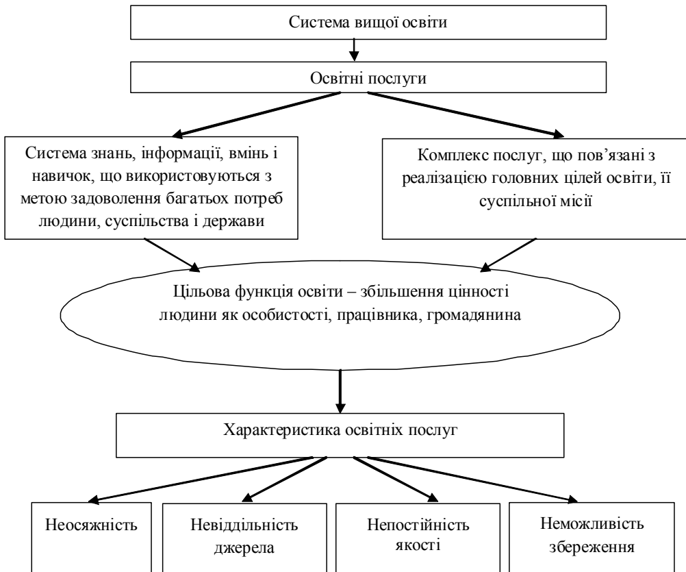
Рис. 2. Сутність освітніх послуг у системі вищої освіти

Аналізуючи наведені визначення, можна дійти висновку, що цільовою функцією освіти є збільшення цінності людини як особи, працівника, громадянина. Специфіка освітніх послуг виявляється в їхніх класичних характеристиках (невідчутність, невіддільність від джерела, непостійність якості, неможливість збереження) та індивідуальних рисах (рис. 2).