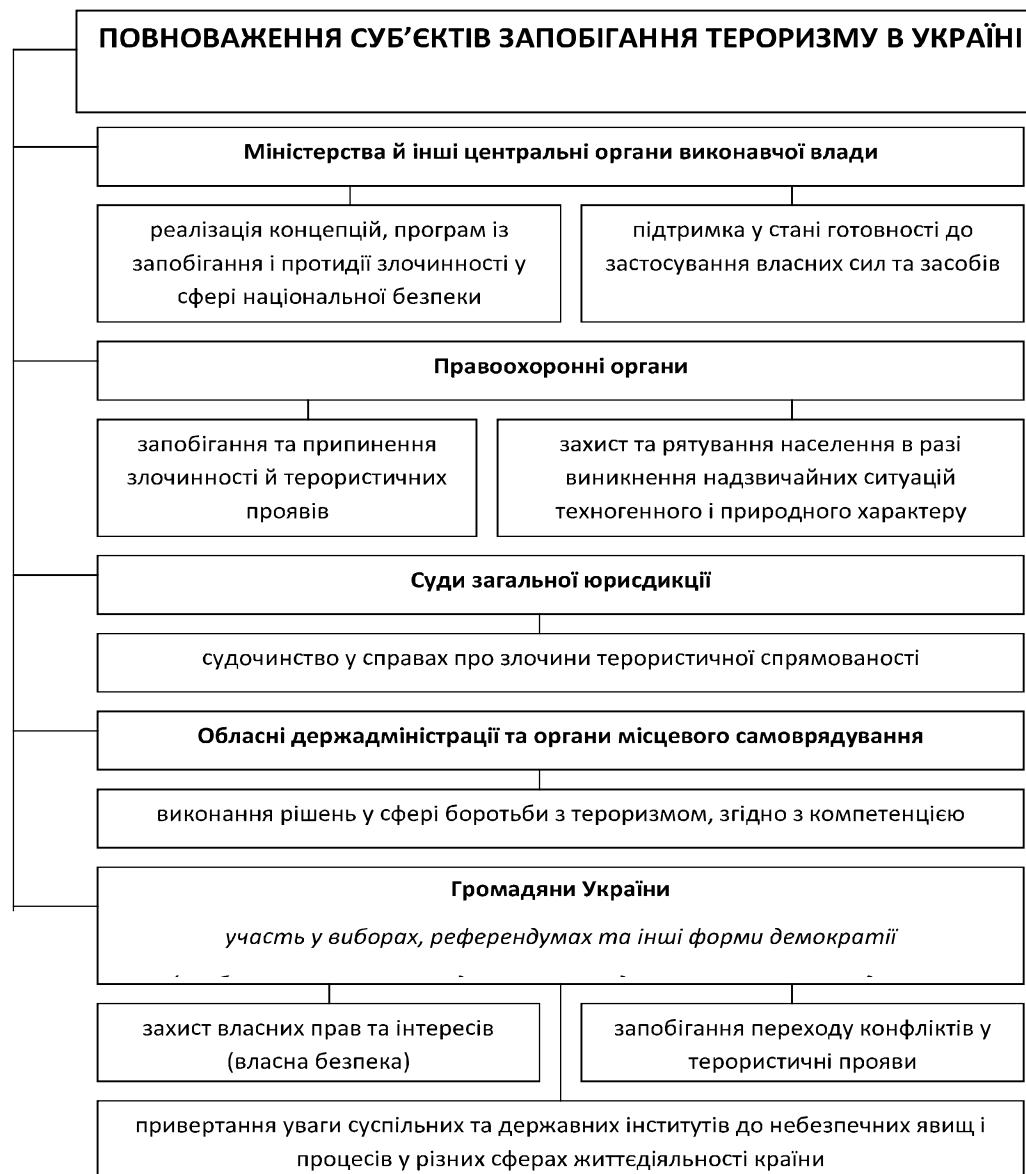
Рис. 3. Повноваження суб'єктів запобігання тероризму в Україні

Отже, безпосередня реалізація політики держави в цій сфері передбачає наявність суб'єктів, завданням яких є недопущення терористичної діяльності. Суб'єкти діють у рамках наданих їм повноважень (рис. 3) (державні й судові органи), а також тих, що реалізують свої конституційні права і свободи в інтересах захисту від злочинних посягань (громадяни України та їх об'єднання) [7, с. 18].