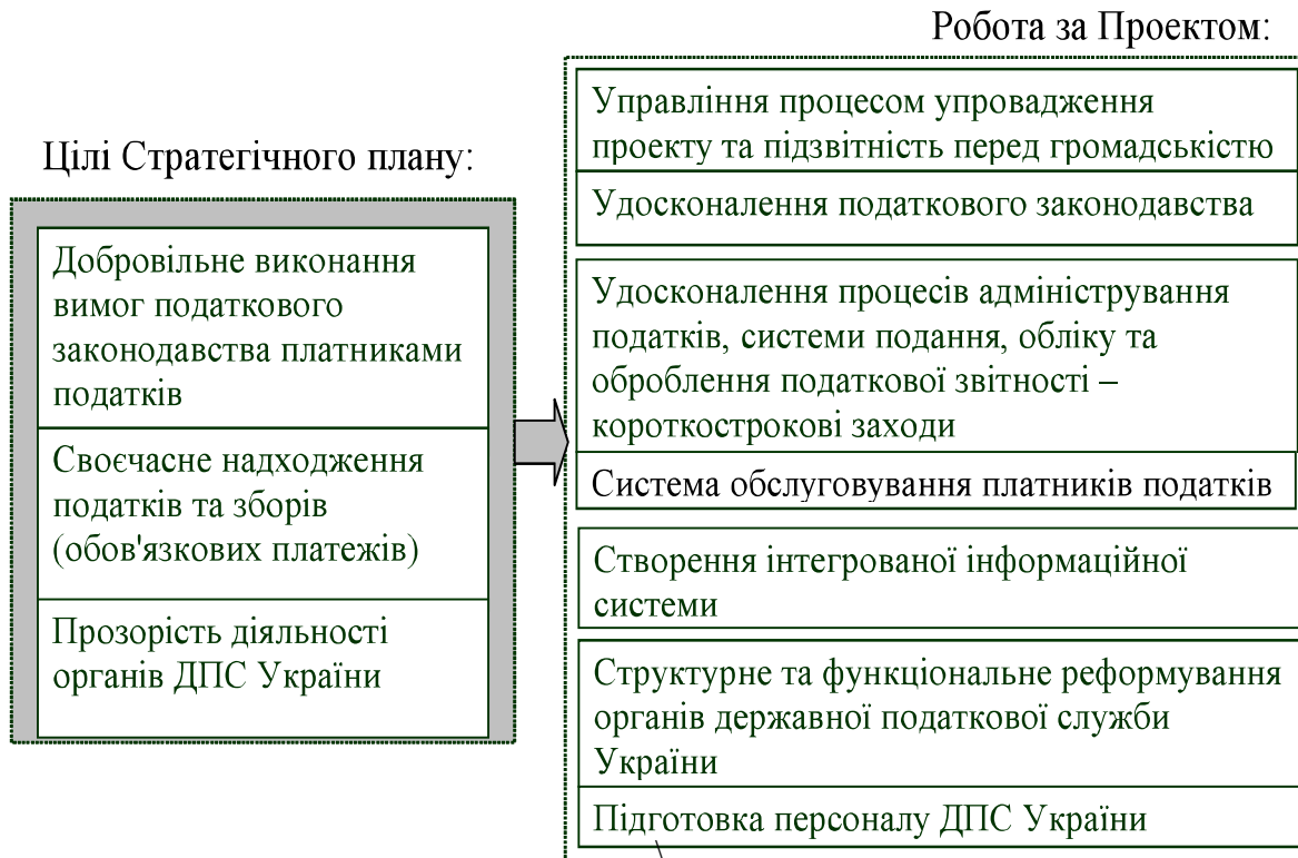
Рис. 1. План Проекту модернізації ДПС України

На етапі підготовки до реформування податкової служби країни було визначено основні напрями модернізації ДПС, що їх було прописано у Стратегічному плані розвитку і затверджено в 2001 р. Для виконання накреслених цілей цієї програми роботу відомства сплановано за пріоритетними напрямами (рис. 1).