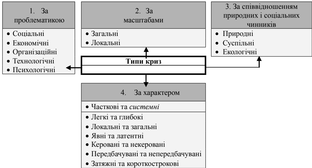
Рис. 1. Типи криз

У складі економічних криз виділяють фінансові – кризи грошового вираження економічних процесів (наприклад, фінансово-грошових можливостей певної системи). Продовженням і доповненням криз економічних є соціальні кризи, хоча вони можуть виникати й самі по собі. Соціальні кризи виникають при загостренні суперечностей чи зіткненні інтересів різних соціальних груп чи утворень. Складовими елементами політичних криз є: втрата репутабельності й авторитету апарату управління, розкол у партіях; ідеологічна криза – руйнація принципів, підвалин моральності, зростання злочинності; криза реалізації інтересів різних соціальних груп та класів тощо). Політичні кризи зазвичай торкаються всіх сторін розвитку суспільства і з часом трансформуються в кризи економічні. А непомірна бюрократизація часто є проявом організаційної кризи.