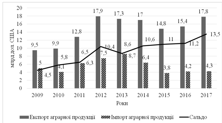
Рис. 2. Динаміка зовнішньої торгівлі України аграрною продукцією, млрд дол. США.