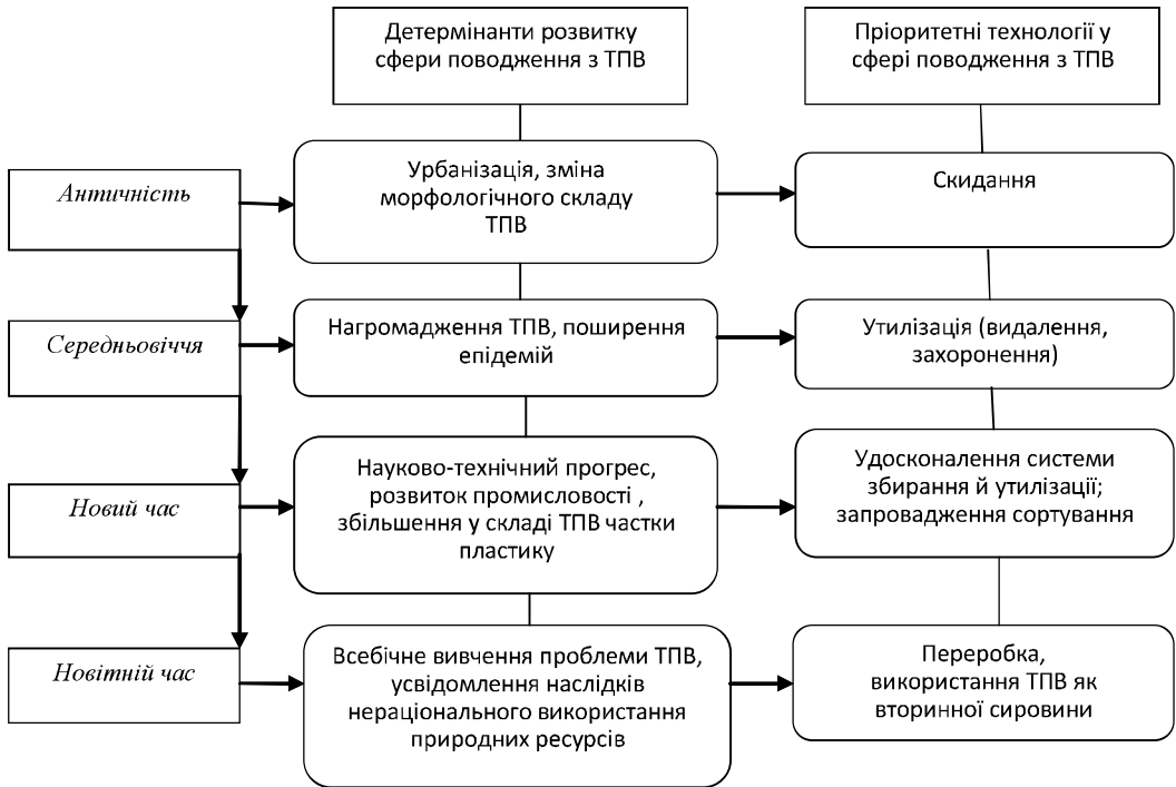
Рис. 1. Основні етапи становлення сфери поводження з ТПВ. Розробка автора

чинників (природні умови, географічне розміщення, корисні копалини, стійкі лиха тощо) та не залежить від суб'єктів у сфері поводження з ТПВ, однак впливають на результати їхньої діяльності. Мікросередовище охоплює комплекс чинників, що пов'язані з діяльністю людини (демографічні, економічні, культурні, політичні, правові, соціальні, технологічні) та зумовляють спроможність суб'єктів у цій сфері здійснювати поводження з ТПВ.