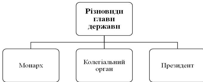
Рис. 1. Різновиди глави держави

Аналіз історичного розвитку інституту Президента показує, що історичні традиції цього інституту сягають глибини віків, епохи Київської Русі. Водночас для України є характерними історичні традиції республіканської форми правління, наявність ідей інституту президентства в українській історико-політичній думці середини XIX – початку XX ст. та існування історичної практики конституційно-правового закріплення цього інституту (рис. 1).