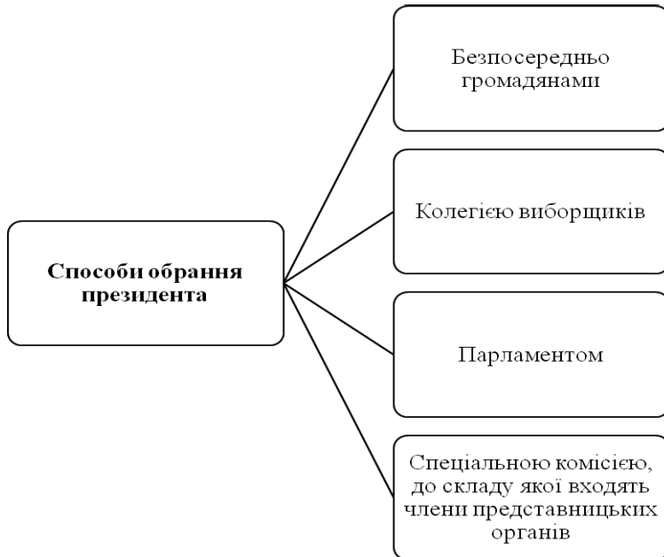
Рис. 3. Способи обрання президента в зарубіжних країнах

Досить широкі повноваження, які має Президент України, не є характерними для парламентсько-президентської республіки, перехід до якої офіційно проголошений Україною в рамках конституційної та адміністративної реформ. Фактично він є як главою держави, так і главою виконавчої влади, що характерно для президентських держав, а юридично, за Конституцією України, має статус лише глави держави, хоча вона ж передбачає для Президента України набагато ширший обсяг повноважень.