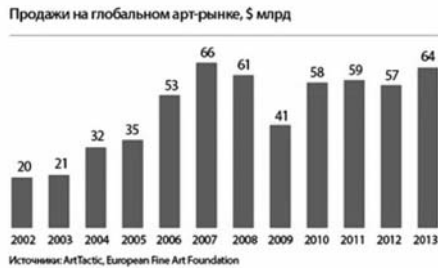
Рис. 1. Динаміка і обсяги продаж на глобальному арт-ринку*