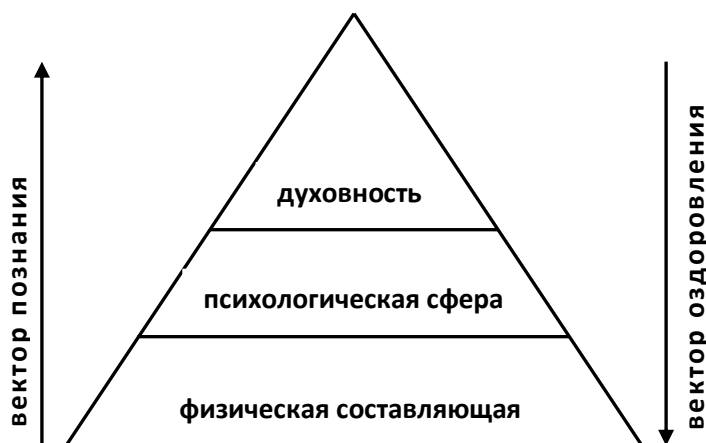
Рисунок 1. Структурная модель человека и ее внешних (пространственных) составляющих.

На третьем (нынешнем) этапе развития знаний о здоровье значительное внимание уделяется духовной составляющей здоровья и его иерархической роли в управлении этим процессом (период развития постнеклассической науки).