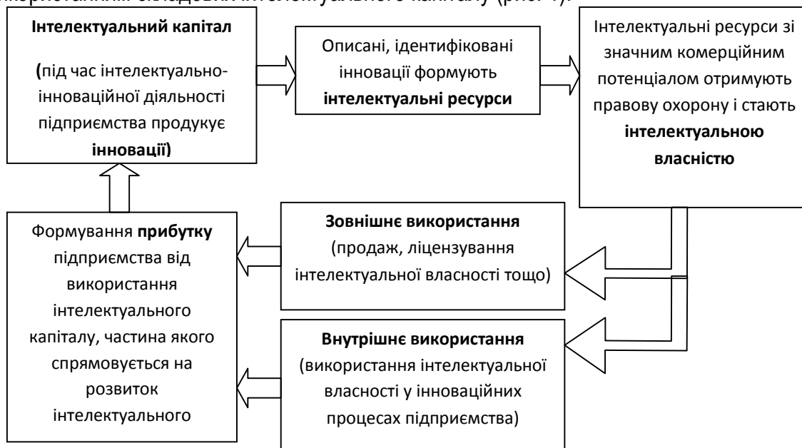
Рис. 1. Схема комерціалізації інтелектуального капіталу підприємства.

Однак головною умовою ефективної комерціалізації інтелектуального капіталу є визначення стратегії перетворення результатів інтелектуально-інноваційної діяльності на активи підприємства. Загалом, розробка стратегії комерціалізації інтелектуального капіталу в межах корпоративної стратегії має ґрунтуватись на результатах аналізу зовнішнього та внутрішнього середовища підприємства і враховувати два стратегічні напрями, пов'язані з внутрішнім та зовнішнім використанням складових інтелектуального капіталу (рис. 1).