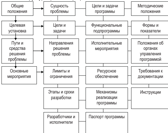
Рис. 1. Схема документальной структуры целевой программы

В укрупненном виде структуру программы можно представить в виде совокупности следующих основных блоков представленных на рисунке 1 – документальная структура целевой программы.