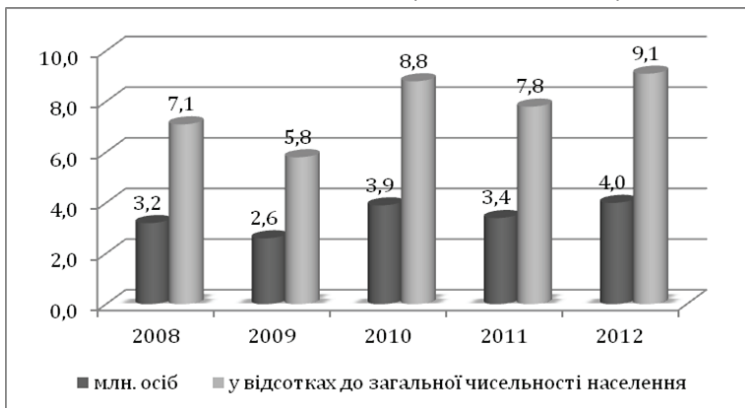
Рис. 2 Чисельність населення із середньодушовими загальними доходами у місяць, нижчими прожиткового мінімуму у 2008–2012 рр.

За результатами дослідження компанії GFK Group, однієї з найбільших компаній з маркетингових та соціальних досліджень у світі, Україна за рівнем купівельної спроможності своїх громадян (менше 3,2 тисячі євро на рік) увійшла до дев'ятки найбідніших держав Європейського континенту станом на 2013 р. З 2010 року в Україні чисельність населення із загальними доходами нижче прожиткового мінімуму поступово збільшується (рис. 2) Таким чином, проблема подолання бідності набуває особливої актуальності.