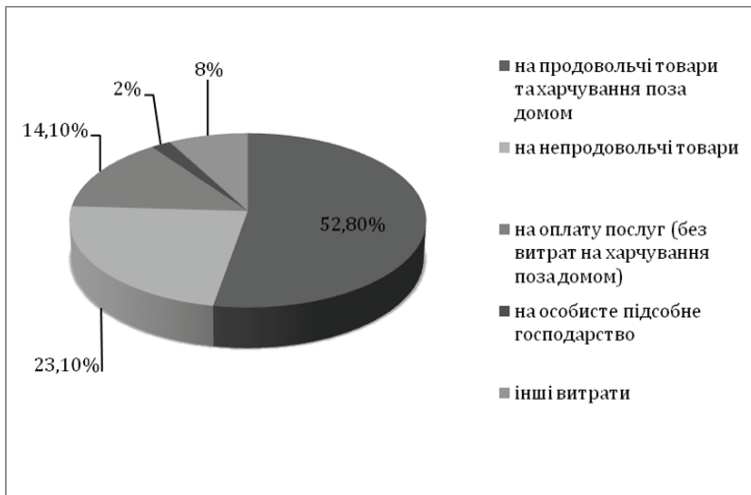
Рис. 3 Структура грошових витрат домогосподарств України у 2012 році Джерело: [13]

У Національній доповіді щодо досягнення Цілей розвитку тисячоліття від 2013 р. вказано, що межею бідності за структурним критерієм є частка витрат на харчування в бюджеті домогосподарств, що перевищує 60 %. При цьому, за даними Державного комітету статистики, витрати домогосподарств України на продовольчі товари та харчування поза домом становлять 52,8 %, що наближається до граничного показника (рис. 3).