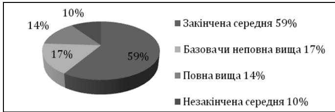
Рис. 4. Рівень освіти українських трудових мігрантів