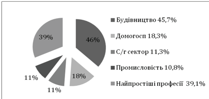
Рис. 3. Основні сфери працевлаштування українських трудових мігрантів Джерело: [13]

Приймаючи іноземну робочу силу, країни-імпортери використовують її як фактор розвитку своїх національних ринків праці.