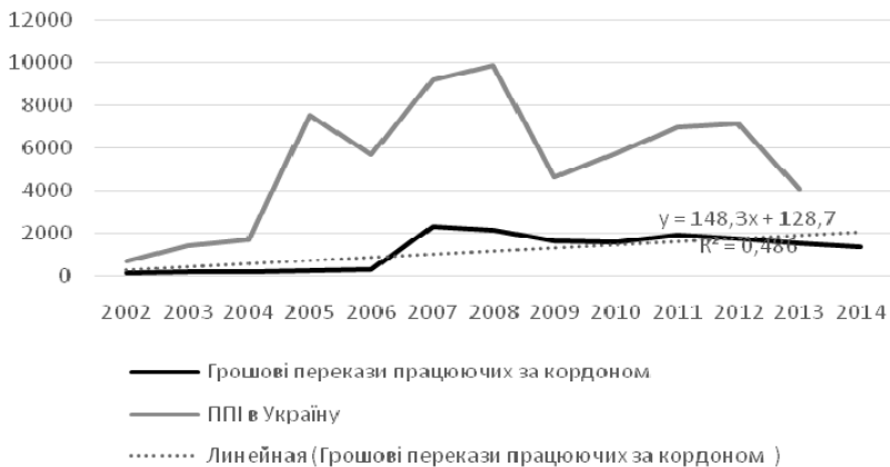
Рис. 4. Динаміка грошових переказів та ППІ в Україні

співставне з скороченням обсягів грошових переказів в 2009 році в результаті економічної кризи в основних країнах призначення українських мігрантів. Однак серед семи країн, з яких надійшло більше ніж дві треті всіх переказів у першому півріччі 2014 року, у чотирьох (Росії, США, Німеччині, Великобританії) спостерігалось незначне зростання економік, а у трьох (Греції, Італії, Кіпрі) – значне уповільнення спаду, тому причини падіння грошових переказів в першому півріччі 2014 року не є такими очевидними.