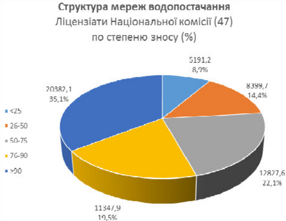
Рис. 1. Структура мереж водопостачання по ступеню зносу (%)

знаходиться у вкрай зношеному стані, 111,9 тис. км у задовільному. Протяжність мереж водовідведення по Україні становить близько 51210,5 км., із них зношеними та аварійними є 18553,2 км. [3,13]. Слід відмітити, що для найбільших компаній країни, на разі, характерний найвищий рівень застарілості основних фондів.