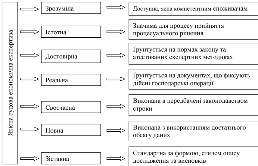
Рис. 1. Структурний зміст якості експертизи

призначення повторної чи додаткової експертиз, що може істотно вплинути на термін досягнення кінцевої мети замовника експертизи. Судова економічна експертиза є процесуальним документом, який має бути складений за певною структурою та мати чітко обумовлені форми висновків – зіставні із загальноприйнятими формами висновків судових експертиз.