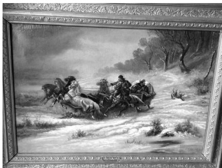
Рис. 1. Неавтентичний твір, який видають за авторство І. І. Орлова, загальний вигляд