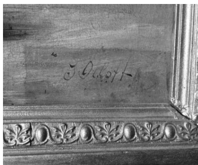
Рис. 3. Підпис від імені І. І. Орлова, виконаний невідомим