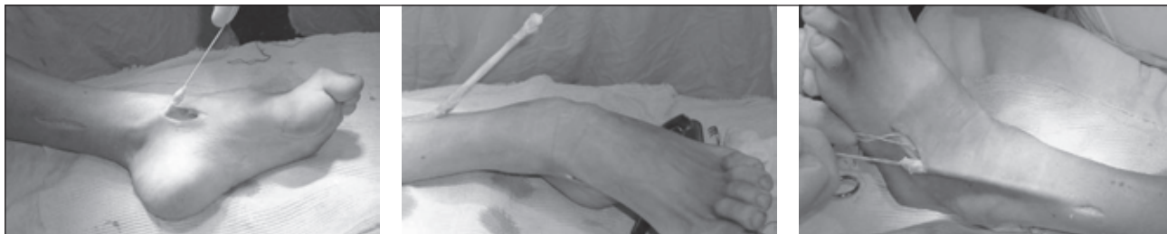
Рисунок 1. Етапи оперативного втручання: транспозиція заднього великогомілкового м'яза на тил стопи