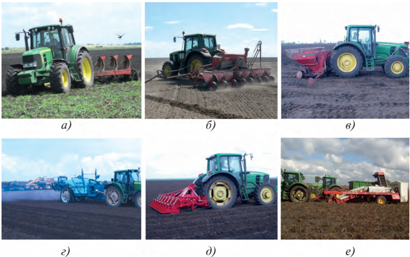
Рисунок 1 – МТА на базі трактора John Deere 6630

У період випробувань трактор експлуатувався з плугом обортовим RS 100, обприскувачем Маххог 40, культиватором-гребенеутворювачем GH 4500, просапною сівалкою Aeromat 8S, картоплексаджалкою UN 3100 і картоплекопачем-навантажувачем Clean Flow 2000 (рис.1).