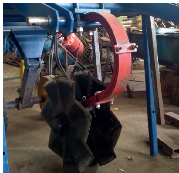
Рисунок 2 – Загальний вигляд стійки регульованої жорсткості виробництва ТОВ «АГРОРЕММАШ-БЦ»

Пропонується, що така стійка дискового робочого органу забезпечує регульовану жорсткість зміною кількості штаб та необхідний її прогин, а також раціональні віброударні властивості. Це дасть змогу підбирати жорсткість стійки під конкретні умови роботи, зокрема в «жорсткому» варіанті на пересушених (4-10 %) і твердих (3,0-3,5 МПа) ґрунтах, що буде сприяти мінімізації утворення пиловидної фракції, та в «м'якому» варіанті на зволоженому (10-27 %) і з твердістю в допустимому діапазоні (1,0-2,5 МПа), що буде сприяти отриманню максимального вмісту агрономічно цінних ґрунтових фракцій розміром до 25 мм. З урахуванням наведених вище розрахунків і міркувань ТОВ «Агро-реммаш-БЦ» виготовлено стійку (рис.2), характеристику наведено в таблиці 1.