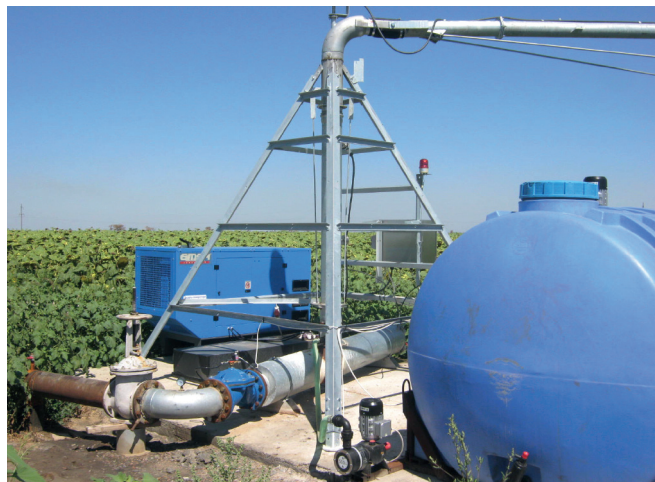
Рисунок 1 – Загальний вигляд розміщення обладнання для внесення добрив з поливною водою

Обладнання є стаціонарним, монтується і працює в агрегаті з дощувальною машиною кругової дії марки Western (рис.1).