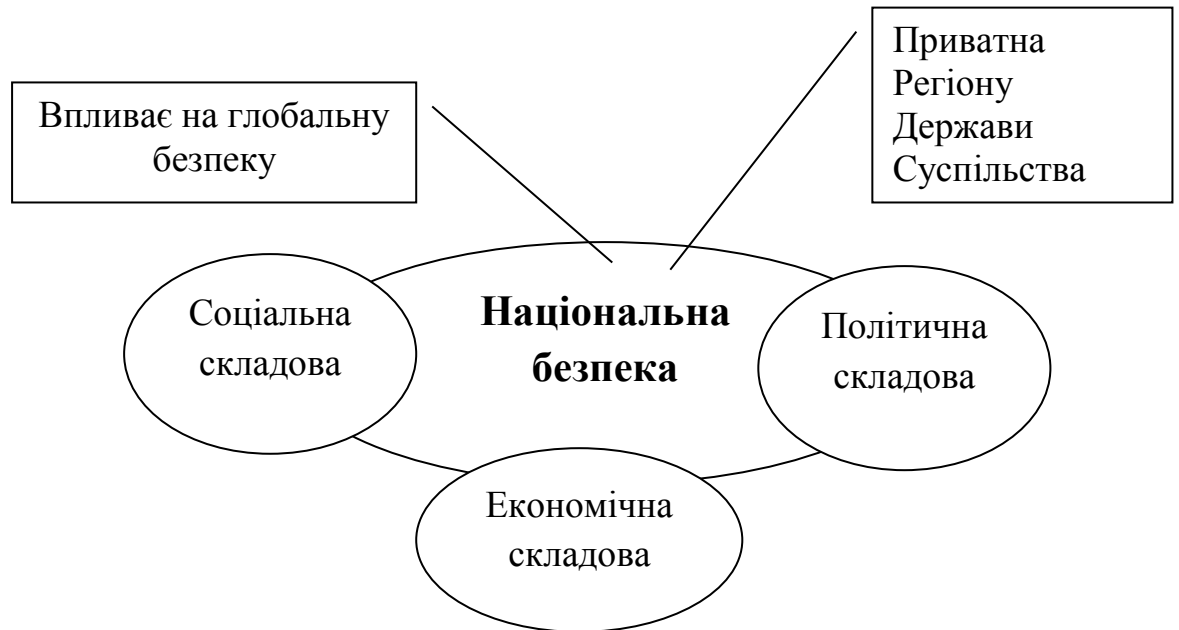
Рис. 1. Зміст поняття національної безпеки

економічної безпеки країни. Вона характеризує здатність державної системи в стабільних і нестабільних умовах забезпечувати населення, промисловість і сільське господарство енергоносіями, тепловою та електричною енергією в тих обсягах і такої якості, які необхідні для стійкого і надійного функціонування.