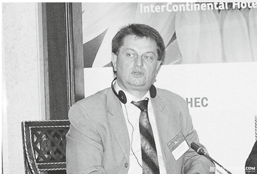
Александр Вержиховский, заместитель главы Государственной ветеринарной и фитосанитарной службы

– Практики по уничтожению поголовья свиней в 60 тыс. у нас нет. Это для Украины впервые и мы учимся на ходу. В первый день мы смогли утилизировать 1,5 тыс. голов, на второй день около 4 тыс. Мы хотим нарастить темпы. Мы также столкнулись с проблемой получения техники. Не каждый откликается даже за деньги, потому что не знает, что потом с ней станет, – признался Жихарев.