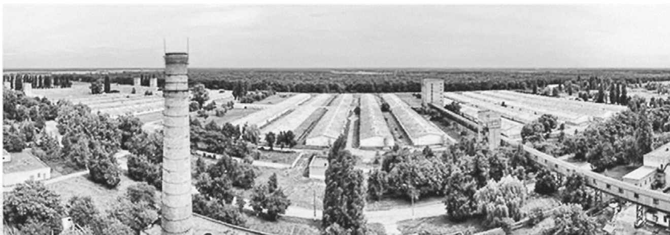
Агропромышленный комплекс «Калита»

Единственный светлый момент в этом темном деле состоит в том, что африканская чума не составляет угрозы для человека. На «Калите» предупредили всех покупателей, чтобы они были аккуратны и перепроверили свой продукт. На сегодняшний день вокруг комбината выставлены санитарные посты, чтобы зараженное мясо не попало на прилавки. Но даже если это каким-то образом произойдет, такая свинина абсолютно безвредна для человеческого организма. Мы являемся лишь еще одним источником для распространения болезни.