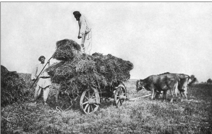
Сінокос на Волині, кінець 19 ст.

ратори? І чи вдалось їм досягнути відчутних успіхів?