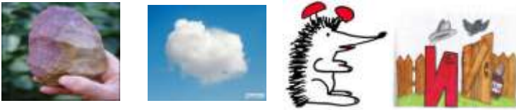
Рис.1 Розрізнення твердих та м'яких приголосних; диференціація букв й –і

Короткі основи можуть даватися як опори при розгляді суміжної тематики, ненав'язливі згадки, приклади, асоціації (Рис. 1).